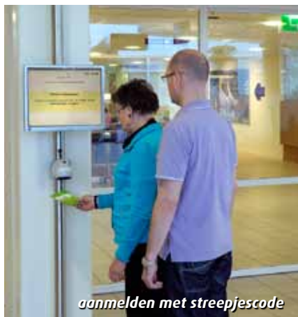
aanmelden met streepjescode

Bij uw eerste bezoek aan de afdeling radiotherapie heeft u een groene kaart met streepjescode gekregen. Met deze kaart meldt u zich altijd aan. Dat doet u door de kaart onder de streepjescodescanner te houden.