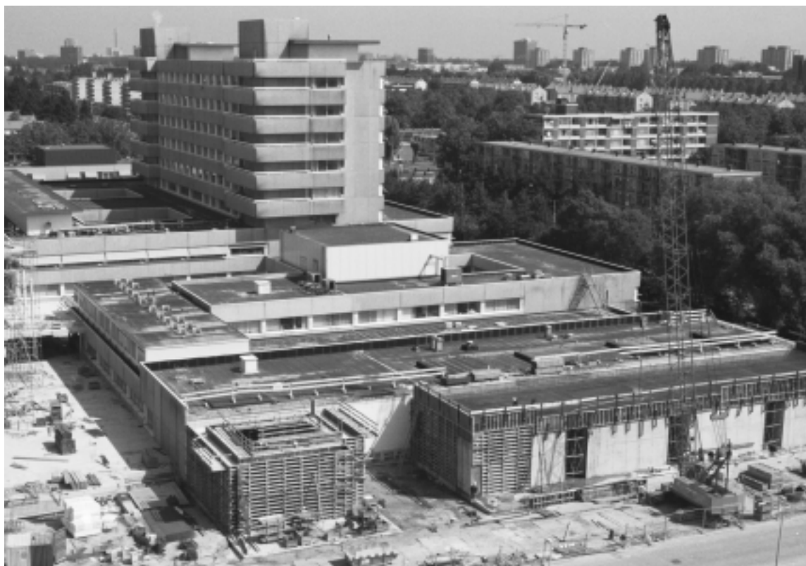
Door de uitbreiding kan het NKI/AvL de wachtlijst voor bestralingen terugbrengen tot maximaal drie weken.