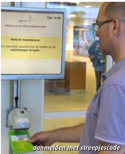
aanmelden met streepjescode

Als u een afspraak heeft voor de voorbereiding op de bestraling, meldt u zich dan bij de receptiebalie van de radiotherapie (let op: NIET de radiologie!). Hier ontvangt u een groene kaart met een streepjescode. Met deze kaart meldt u zich altijd aan; bij een bestralingsafspraken maar ook voor alle andere afspraken. U meldt zich aan door de kaart met de streepjescode onder de streepjescode-scanner te houden. Deze staat aan een paal vóór onze glazen schuifdeuren. Op het scherm kunt u dan aflezen welke afspraken u die dag heeft. U hoeft zich slechts één keer op een dag aan te melden.